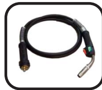
تورچ هواخنک Air cooled Torch