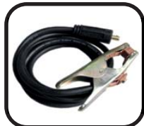
کابل جوشکاری با گیره اتصال به قطعه کار Welding cable including earth clamp