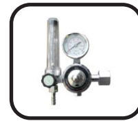
رگولا تورو هیتر گاز Regulator and gas heater