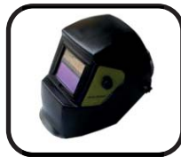
ماسک الکترونیک Electronic mask