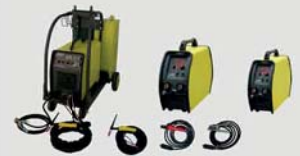
TIG AC/DC (Inverter)