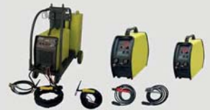
TIG AC/DC (Inverter)