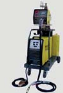
TIG DC (Inverter)