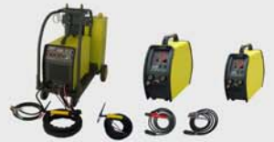
TIG AC/DC (Inverter)