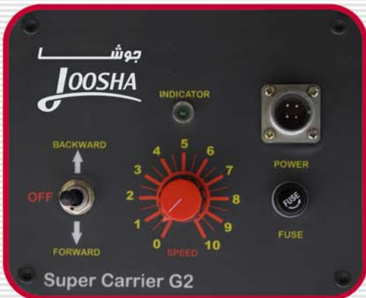
Super Carrier G2