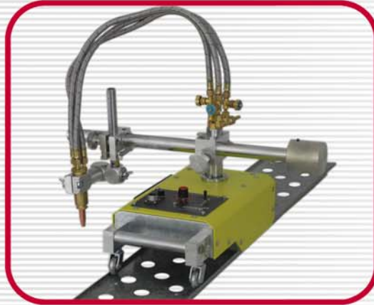
Gas Cutting Machine (G1)